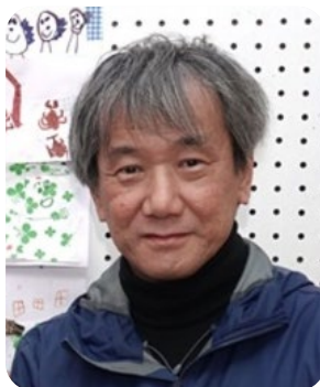
学校法人 岡崎学園 理事長 荒尾第一幼稚園 園長